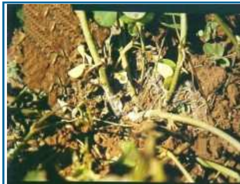
Murcha de Sclerotium

A ocorrência da murcha de Sclerotium é favorecida pelo acúmulo de matéria orgânica resultante da desfolha natural ou causada por doenças foliares durante o ciclo, por plantas com a parte aérea bem desenvolvida, criando um microclima favorável ao desenvolvimento do patógeno junto à base das plantas, pela ampla gama de hospedeiros do S. rolfsii e sobrevivência dos escleródios no solo por 3-4 anos.