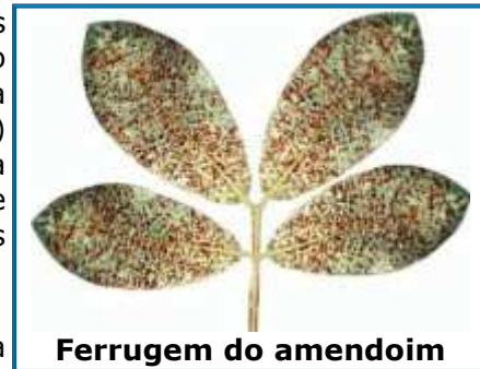
Ferrugem do amendoim

A ferrugem aparece inicialmente como pequenos pontos amarelados visíveis na superfície dos folíolos, que caracterizam o início da formação de pústulas (uredossoros). Posteriormente, com a ruptura da cutícula e exposição das massas de esporos (uredosporos) na face inferior dos folíolos, as pústulas passam a apresentar a coloração característica marrom-avermelhada, com 0,3 a 1 mm de diâmetro, que dá o aspecto pulverulento e ferruginoso às folhas severamente infectadas.