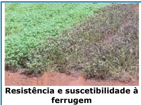
Resistência e suscetibilidade à ferrugem

Com o desenvolvimento, os esporos podem ser observados na face superior dos folíolos, na posição oposta às existentes na face inferior, especialmente nos genótipos mais suscetíveis. As pústulas em raras ocasiões podem ser observadas em outras partes aéreas das plantas, exceto em flores e ginóforos.