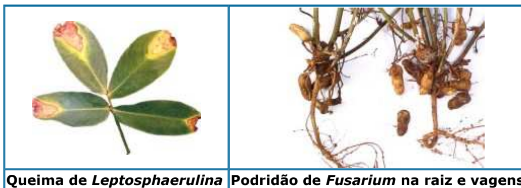
Queima de Leptosphaerulina

A queima das folhas de Leptosphaerulina crassiasca (mais comum em cultivares rasteiros do grupo Virgínia, em ocorrências sazonais durante os meses quentes e chuvosos de verão); o mofo cinzento ou queima de Botrytis cinerea (mais comum com temperaturas mais baixas, de 15-20 °C, e umidade relativa superior a 80%); as podridões de vagens e raízes de Fusarium spp. (fungos comuns nos solos, cuja importância está mais correlacionada com a ação conjunta com outros patógenos de solo, que individualmente); a mancha anular ("Tomato spotted wilt virus - TSWV" - vírus também conhecido por do vira-cabeça do tomateiro, causando o subdesenvolvimento das plantas, a formação de rosetas na extremidade das hastes, a necrose do parte apical e folhas com áreas cloróticas irregulares ou em forma de anel, cujo principal vetor é o tripses).