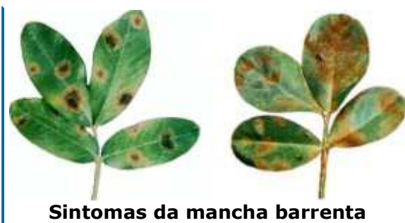
Sintomas da mancha barrenta

página superior das folhas. Com a evolução da doença, essas lesões crescem e coalescem, abrangendo grande área dos folíolos, sendo então visíveis também na superfície inferior das folhas, com os tecidos necrosados não se mostrando totalmente coincidentes com a face superior; na fase mais avançada da doença as folhas parecem ter sido salpicadas de barro.