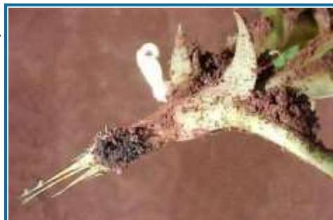
Podridão do colo de A. niger

Logo após o plantio, o fungo pode infectar as sementes, que apodrecem rapidamente, tornando-se moles e cobertas por uma densa massa escura, constituída pelos conidióforos e conídios do fungo. As plântulas infectadas apresentam lesões na região do hipocótilo, ao nível do solo. A podridão no hipocótilo é caracterizada por uma lesão amarelo-escuro, que se estende para o interior dos tecidos. Na superfície de áreas afetadas, usualmente podem ser vistas massas pretas de conidióforos e conídios do fungo.