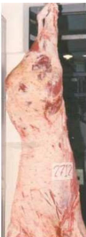
Exterior da carcaça de Nelore com boa cobertura de gordura