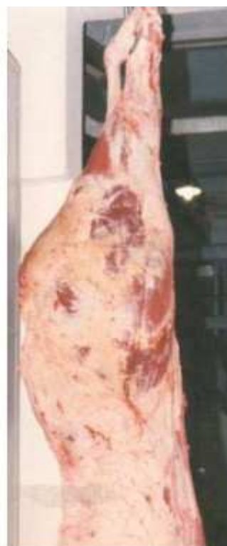
Detalhe do acabamento do traseiro de Nelore