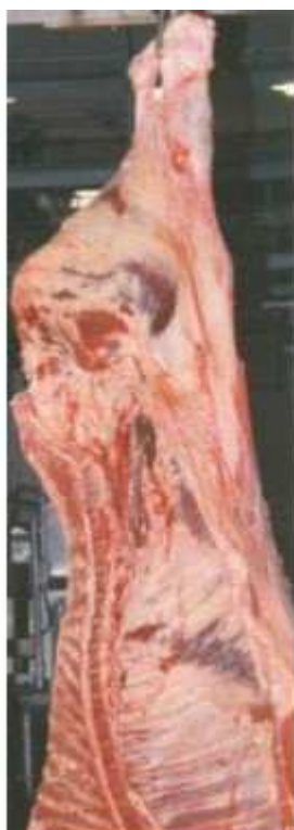
Parte interna da carcaça de Nelore