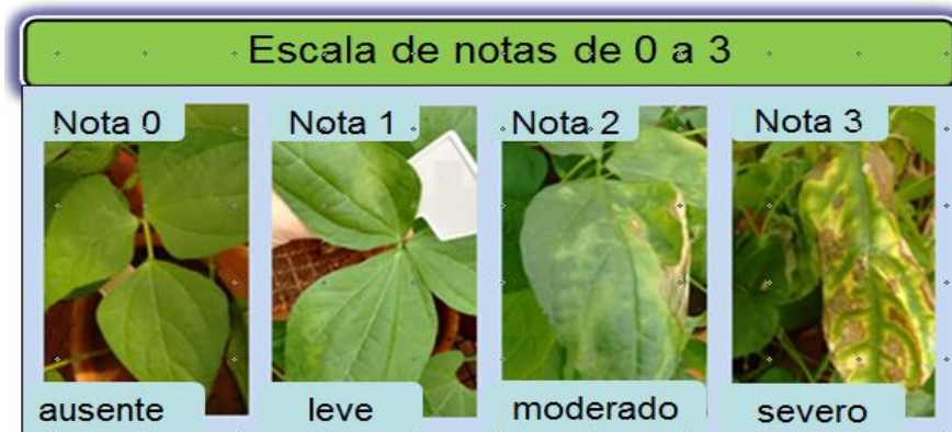
Figura 1. Representação da escala diagramática com notas de 0 à 3 para avaliar a severidade de ocorrência de Curtobacterium flaccumfaciens pv. flaccumfaciens em parte aérea de feijão.

Avaliou-se a severidade semanalmente, por um período de 30 dias a partir do décimo dia após a inoculação, utilizando-se uma escala diagramática com notas de 0 a 3 descrita por Leite JR et al., 2001 (Figura 1). Foi utilizado o delineamento experimental de blocos casualizados, com cinco repetições.